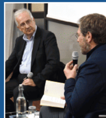
2024 Incontro con Walter Veltroni e Roberto Invernizzi