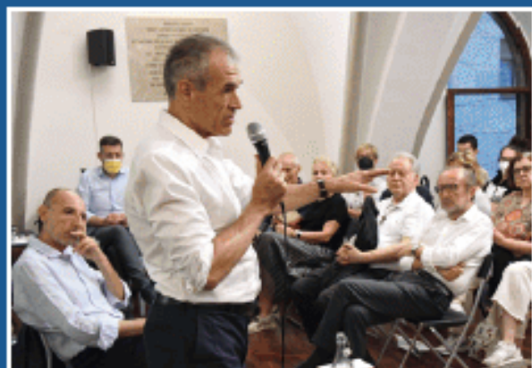
2022 Festa del Libro con Carlo Cottarelli