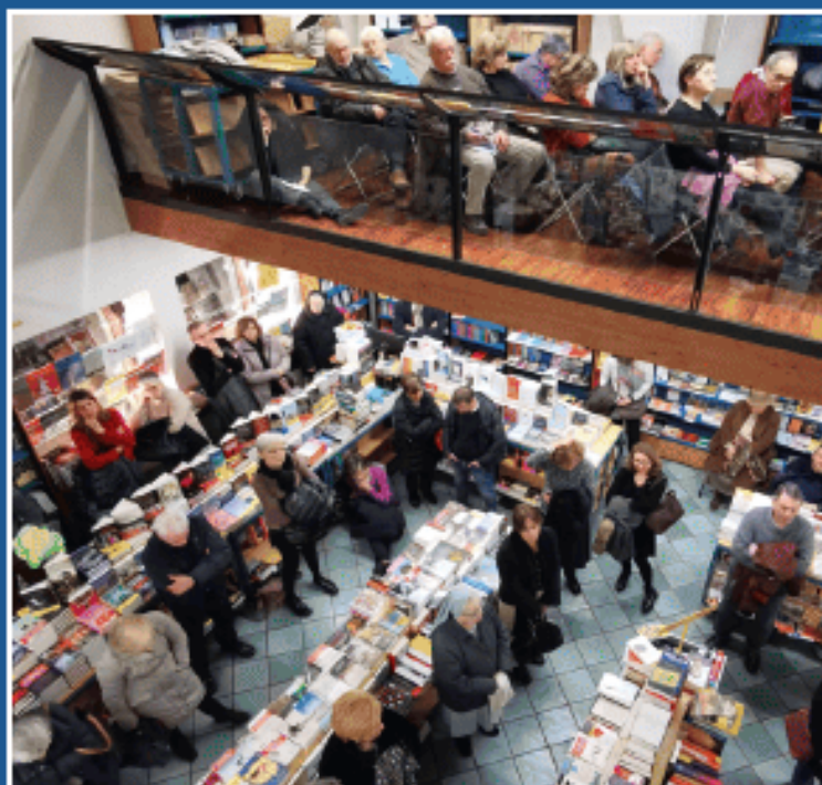
2024 Una presentazione letteraria sold out