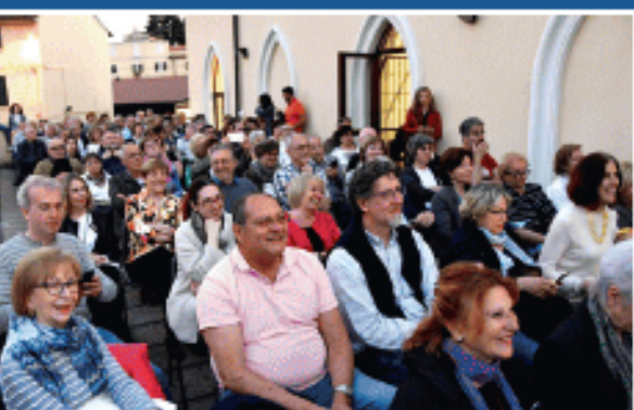
2019 Festa del Libro in terrazza