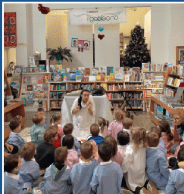
2022 Trezzo, animazione per bambini